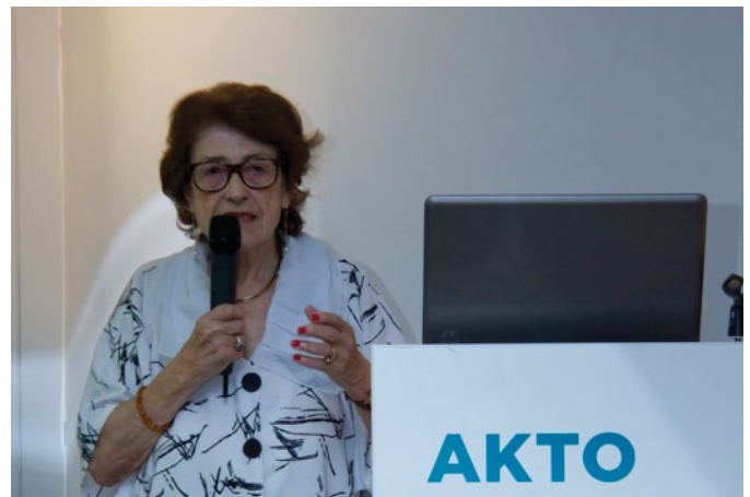
Μίκα Χαρίτου-Φατούρου (Ομότιμη Καθηγήτρια Ψυχολογίας στο ΑΠΘ) - "Θετική Ψυχολογία: Το όμορφο μας βοηθά να αντιμετωπίσουμε το άσχημο"